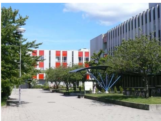
...en annan arkitektur, skapad 1970 som annex till Boo sjukhus