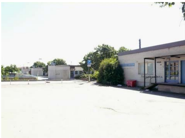
1960-talets skolorkitektur (Nybackaskola)