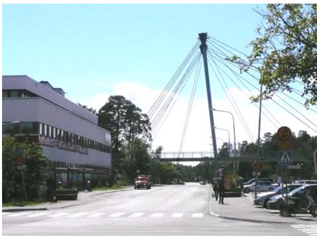
Hängbron till Orminge centrum