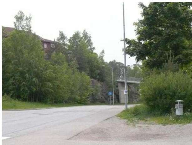
....och cykelbro i Östra Orminge