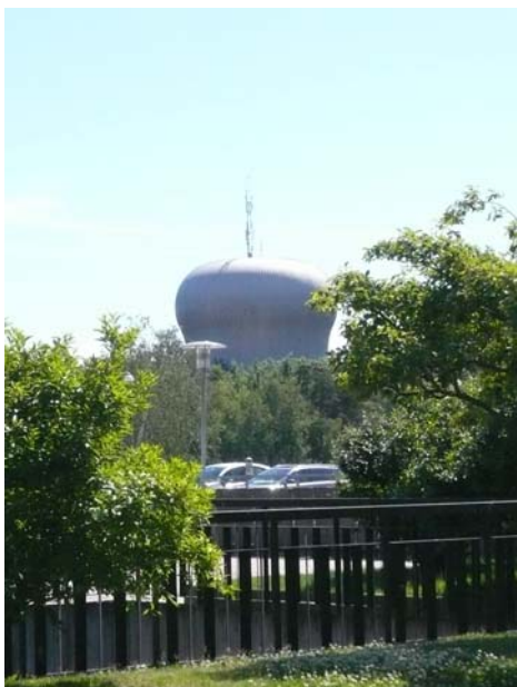
"Röksvampen", Orminges vattentorn