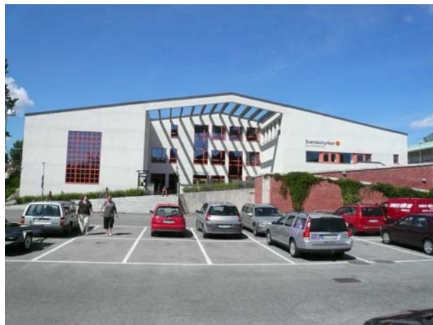
....och nya församlingshuset