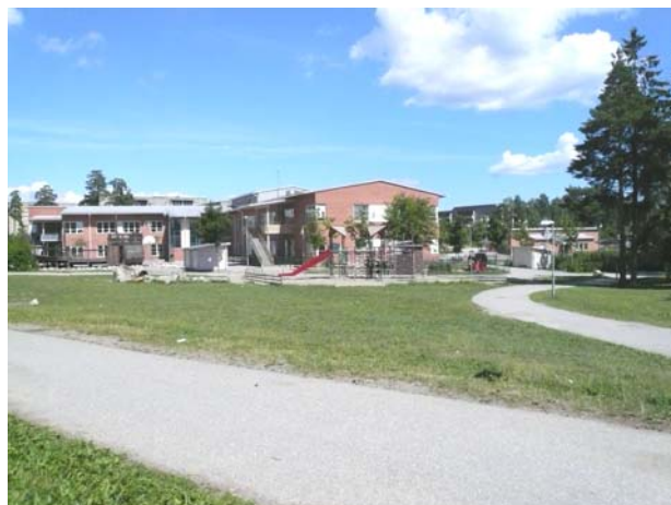
och dagens (nya Brännhällsskola)