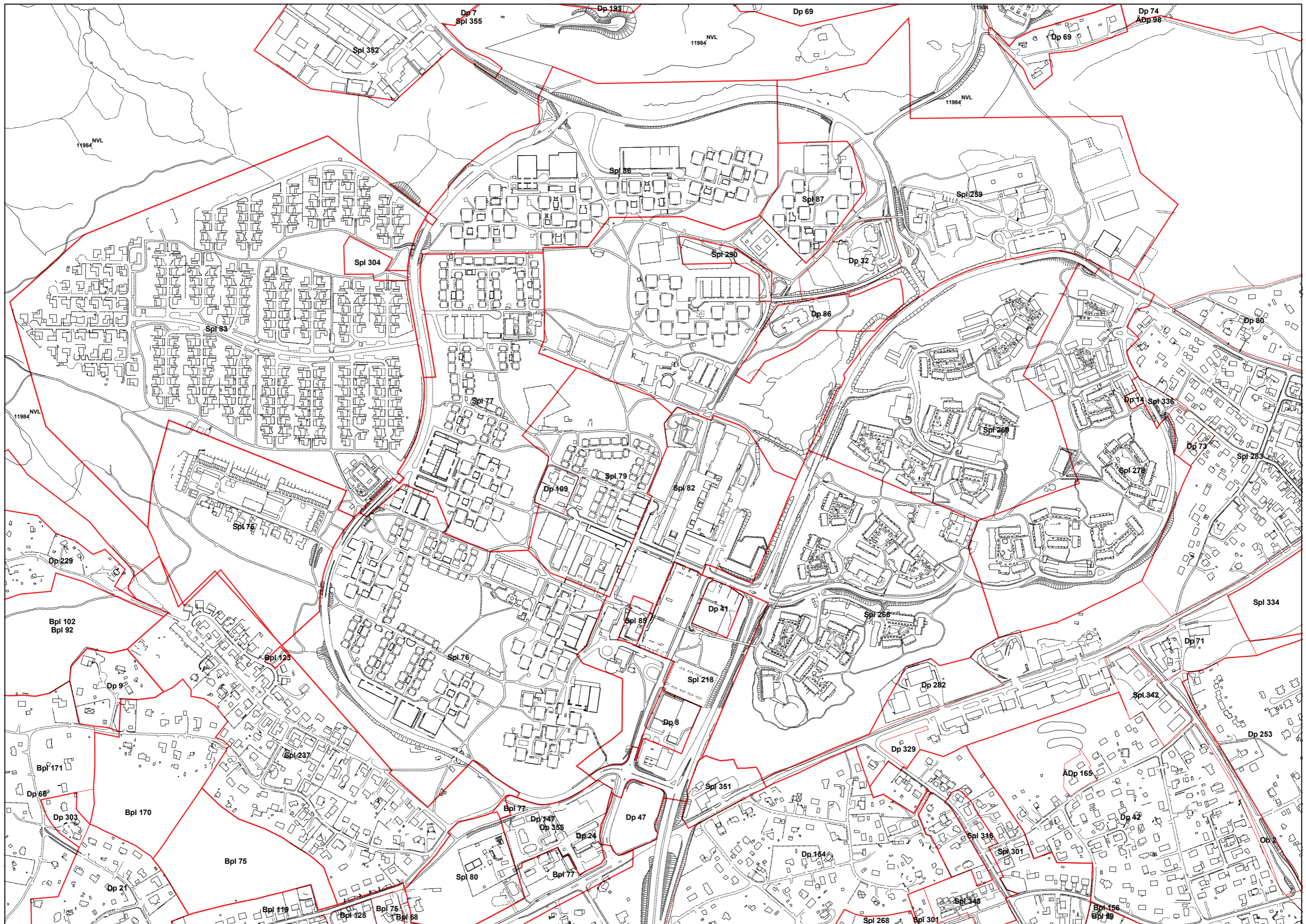
Plangränser med beteckningar