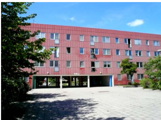
”Långa röda huset”, en plåtfasad ur 1960-talets arkitektur