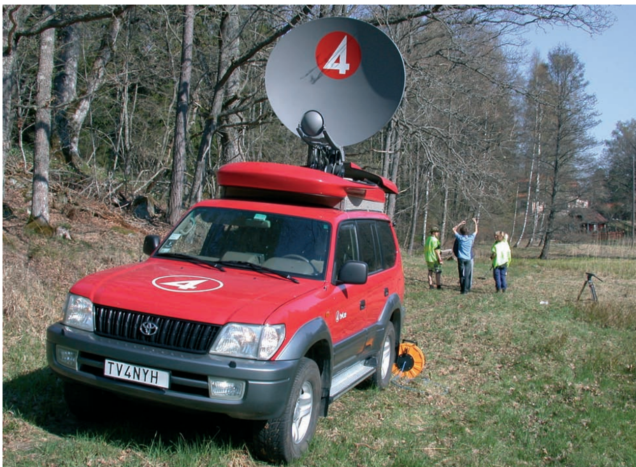
Fig. 3. TV4 på plats för ett direktsänt morgoninslag.