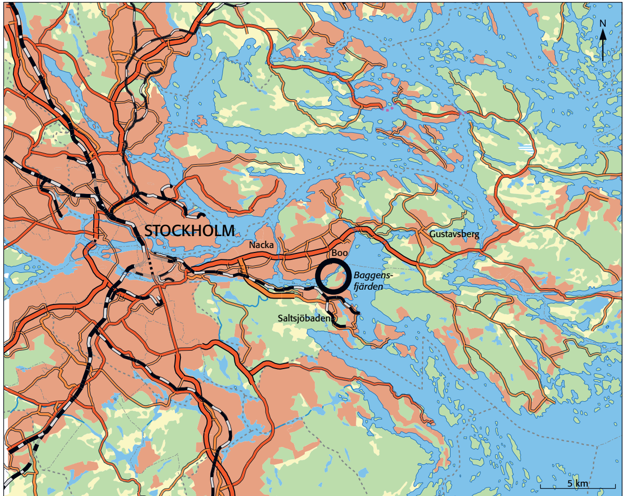
Fig. 1. Utsnitt ur Översiktskartan, Stockholms län, med platsen för undersökningen markerad. Skala 1:250 000.