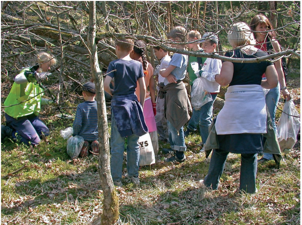
Fig. 4. Lågstadieklass från Saltsjöbaden på besök.